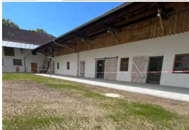
Text und Fotos: Birgit Neumair