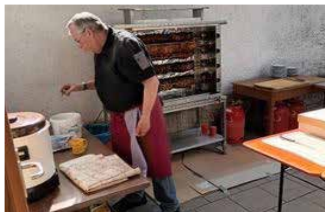
Grillmeister bei der Arbeit