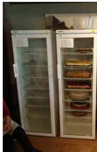
Vielzahl an Kuchen