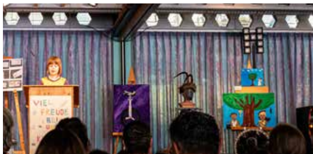
Text: Anke Bille

stets auch Neues zu erfahren. Besonders deutlich wurde, wie intensiv und engagiert sich die Kinder mit einem Thema auseinandersetzen, wenn es ihrem eigenen Interesse entspricht