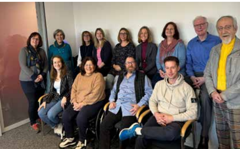
Mitglieder des Inklusionsforums

in Arbeitskreisen zu den Schwerpunkten Mobilität und Wohnen sowie Bewusstseinsbildung aus. In den Arbeitskreisen entstehen verschiedene Projekte. Genau aus diesem Grund lesen Sie nun diesen Artikel. Der Arbeitskreis Bewusstseinsbildung wird für eine Laufzeit von einem Jahr einmal monatlich jeweils ein Thema aus dem Bereich der Inklusion aufarbeiten. Es wird beispielsweise zur Integration in der Arbeit, der Barrierefreiheit im öffentlichen Raum und vielem mehr Informationen geben. Das Ziel des Inklusionsforums ist es, so Sie als Bürgerinnen und Bürger auf die Belange von Menschen mit Behinderung aufmerksam zu machen, um so das Bewusstsein und die Teilhabe in der Gesellschaft zu fördern.