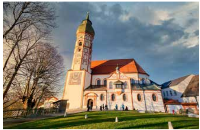
Texte und Fotos: Marie Gamperling

Die Vorfreude auf die Brotzeit und den Andechs Bock nach der Ankunft steigt. Von Günzlhofen gehen die Wallfahrer um 4 Uhr morgens am 8. Mai los. Wenn auch du dieses Jahr dabei sein magst, denk daran bald Urlaub zu nehmen.