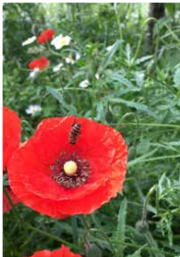
Anke Bille

Doch nun, als keiner mehr damit gerechnet hat, stellt sich der Erfolg ein. Die Wiese ist aufgeblüht und der komplette Hang steht in voller Pracht da. Damit haben wir den Insekten eine große Fläche mit dem für sie so notwendigen Lebensraum geschaffen. Vielleicht kommen im nächsten Frühjahr ja auch noch die Krokusse zum Vorschein.