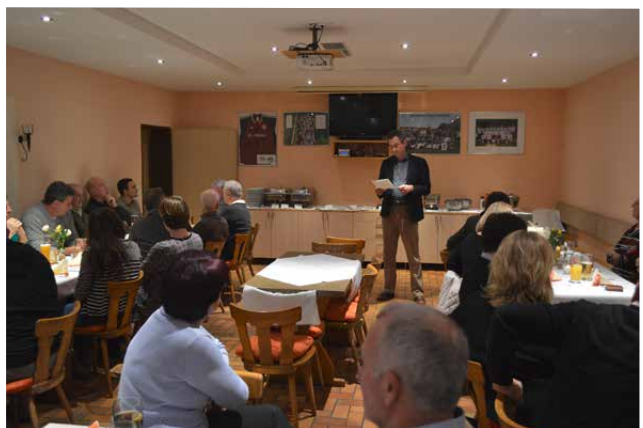
Jahresessen der Gemeinde